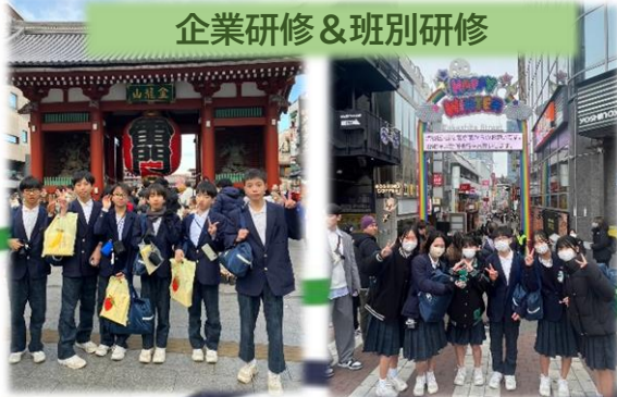
企業研修&班別研修

東京は建物が高くて、右を見ても左を見ても、ビル、ビル、ビルでした。世羅はどこを見ても山ばかりです。あと、東京の人は歩くスピードが速くて、みんな何かに追われているかのようでした。