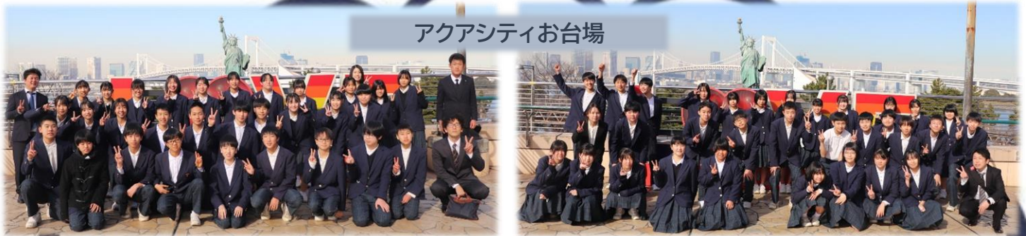
アクアシティお台場

企業訪問は、第1希望のところにいくことができ、興味のあるところで良かったです。国立競技場はテレビで見るよりもすごく迫力がありました。