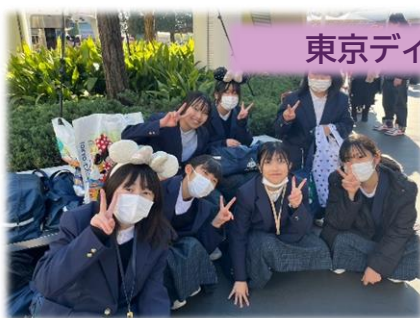
東京ディズニーランド